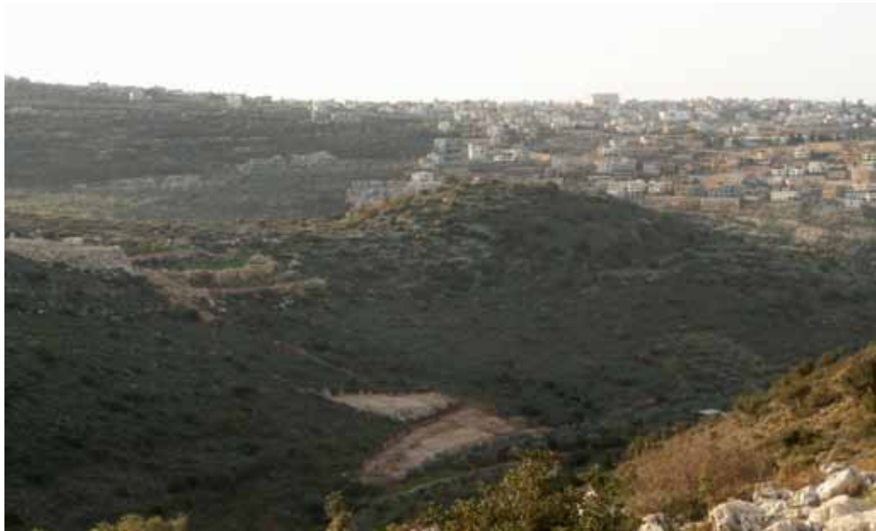
איור 2. ראס כלבן מראה הפסגה.

מרחבי עמק עכו, נחשפו במהלך ארבע עונות חפירה שנערכו בשנות השבעים של המאה הקודמת, שלבים שונים של ביצור למן התקופה ההלניסטית עד לתקופה העות'מאנית (פראוסניץ 1997). למרבה הצער פורסמו רק ידיעות מצומצמות על החפירה. מן הממצאים עולה כי את הביצור הקדום במקום יש לשייך לתקופה ההלניסטית, המאות ה-2-3 לפנה"ס. מעליו הוקם ביצור בתקופה החשמונאית שחרב במאה ה-1 לפנה"ס.