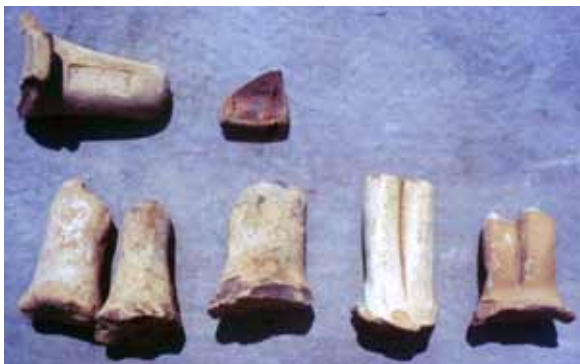
איור 4. ידיות של קנקני יין מיובאים ושבר של קערה עשויה בדפוס.

נחף, השוכן בראש גבעה נישאת מעל העמק, נחפרו שרידים מהתקופה ההלניסטית הכוללים, בין השאר, מבנה שקירותיו היו מכוסים בפרסקו וכן כלי חרס ומטבעות. כמות גדולה של קנקני אגירה מטיפוס קירמיקה גלילית גסה כמו גם אמפורות מיובאות בעלות ידיות חתומות, יש בהם אולי להעיד על מבנה בעל משמעות מנהלית/צבאית (Smithline 2008: 100-99). בחורבת באר שבע הגלילית שבקצה המזרחי של בקעת בית כרם, בראש גבעה מבודדת וגבוהה, נסקרו שרידיו של יישוב מבוצר (מצודה?) מן התקופה ההלניסטית (טל, טפר ופאנטאלקין 2000).