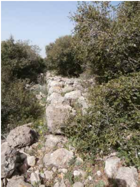
איור 6. הקיר הדרומי של המצודה בהר עצמון.

במהלך הסקרים הארכיאולוגיים שנערכו בגליל, התגלה טיפוס של כלי חרס שכונה על ידינו הסוקרים 'קירמיקה גלילית גסה' (GCW – Galilean Coarse Ware; אביעם תשנ"ו: 257-258). טיפוס זה התחיל להופיע בשלהי התקופה הפרסית ועיקר תפישתו במרכז הגליל העליון ומזרחו וגם בצפון הגליל התחתון. קירמיקה זו