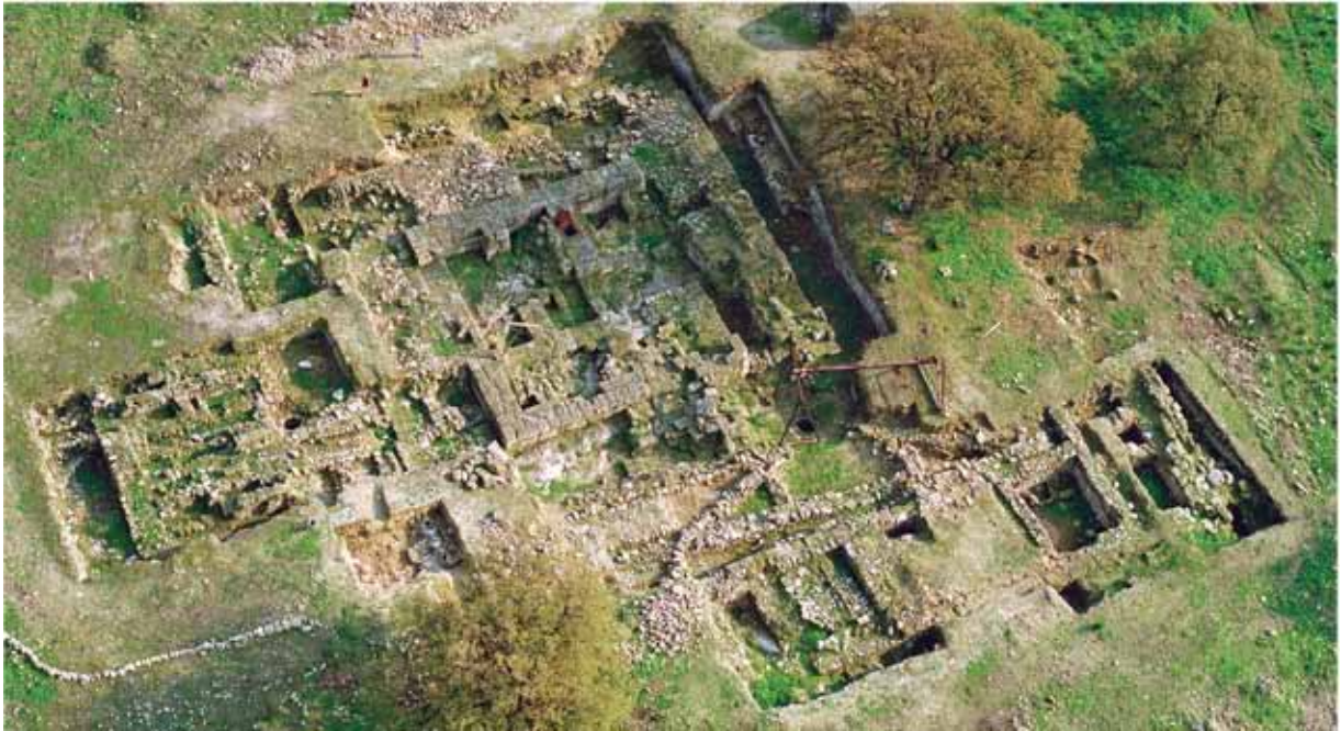
איור 3. המגדל בשער העמקים.