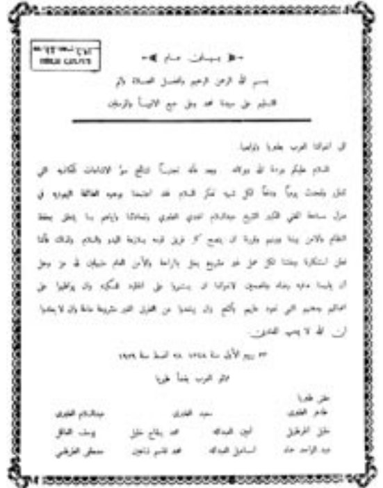
הכרוז של נכבדי טבריה ערב מאורעות 1929 בו הם דרשו לשמור על שקט בעיר