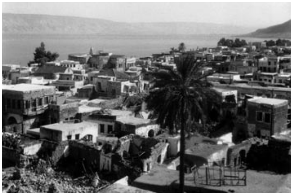
הרובע העתיק בטבריה, תחילת המאה העשרים

בקהילה הערבית בטבריה לא הייתה שכבה רחבה של משפחות נכבדות כמו בערי הארץ הגדולות, ואפילו לא כמו באלה שדמו לה בגודל אוכלוסייתן כצפת ועכו. הייתה בה רק משפחה מוסלמית אחת שאפשר להתייחס אליה כאל משפחת נכבדים טיפוסית, והיא משפחת טברי, שרבים מבניה מילאו תפקידי דת ומנהל במשך כמה דורות. בתקופה העות'מאנית היו אמנם כמה משפחות שהחזיקו בתפקידים חשובים בעיר – כמו משפחת חסין 8 ומשפחות ג'רייב וסחתות, שאחדים מבניהן כיהנו במועצה המנהלית ובמועצת העיר – אולם לא היה בכוחן להתחרות במעמד, בהשפעה, בעושר ובשטחי הקרקע הנרחבים של משפחת טברי.