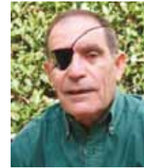
פרופ' חנוך לביא נשיא המכללה