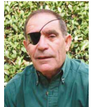
פרופ' חנוך לביא נשיא המכללה